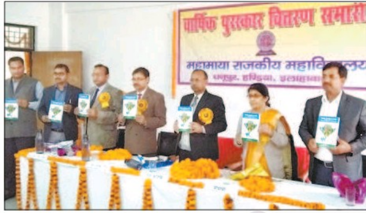
हंडिया में पुरस्कार वितरण समारोह में मौजूद अतिथि।

महामाया राजकीय महाविद्यालय के प्रतिभावानों को वार्षिक पुरस्कार वितरण में किया गया सम्मानित