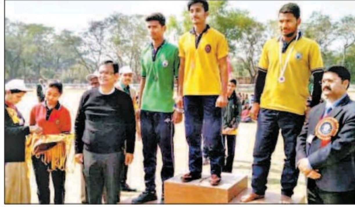
फूलपुर केवी में विजेता खिलाड़ी और मौजूद अतिथि।