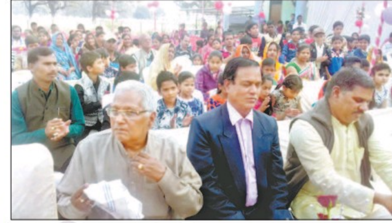
सैदाबाद में आयोजित कार्यक्रम में मौजूद अतिथि।